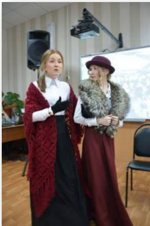
Дамы Серебряного века